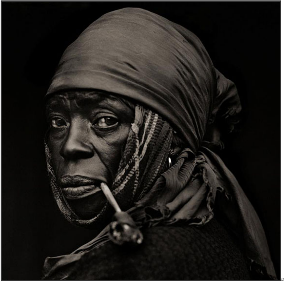
Dana Gluckstein, Frau mit Pfeife, Haiti 1983