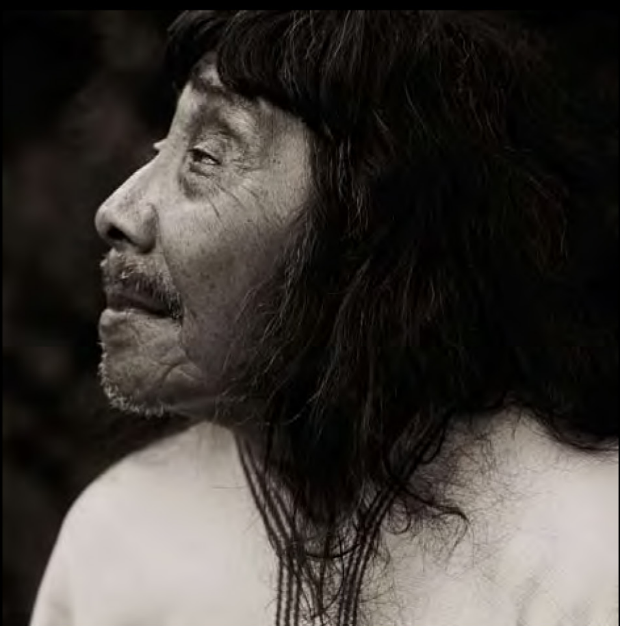
Un chaman lacandon, ethnie maya vivant au cœur de la forêt tropicale, dans le Chiapas mexicain.