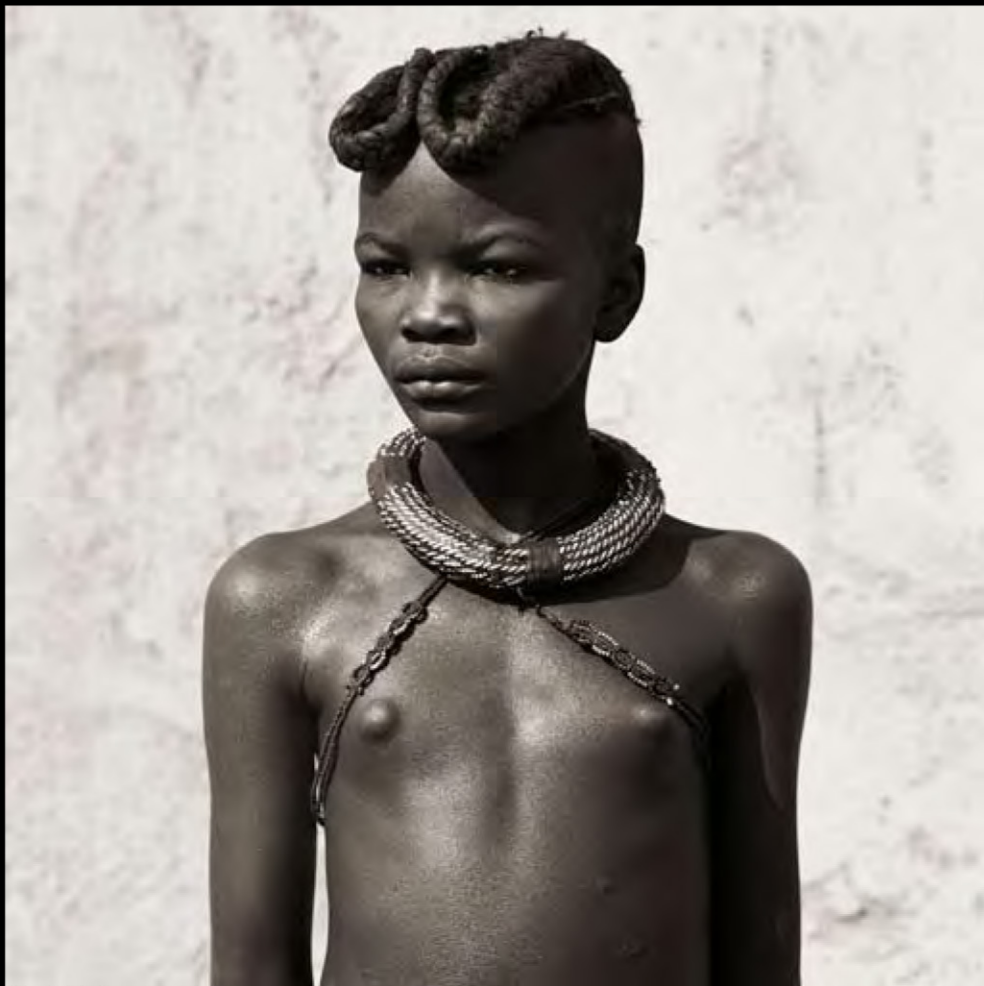
Ils sont désormais moins de 50 000 membres du peuple himba à vivre dans le nord de la Namibie.