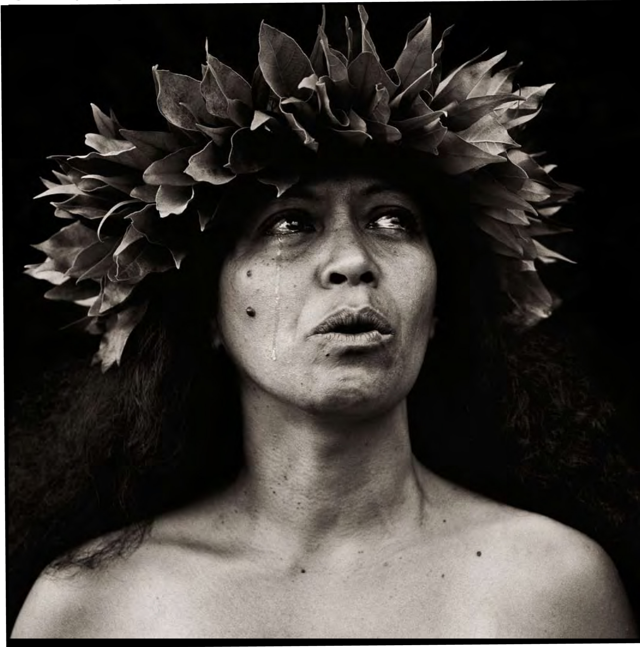
1996, un chanteur traditionnel à Hawaï (Etats-Unis).