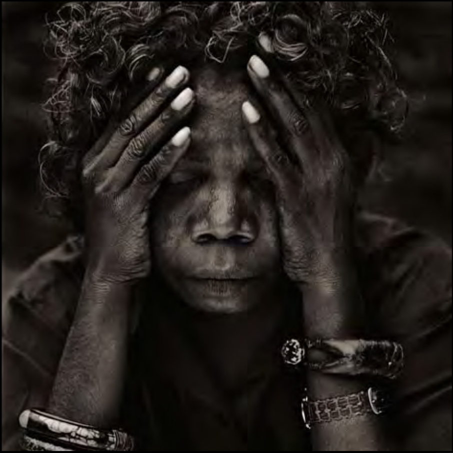
Australie 1996, portrait d'une artiste peintre aborigène.